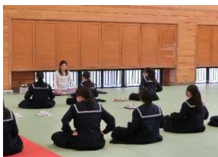
(ヨガインストラクター)