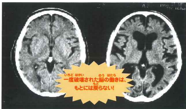
アルコールで縮んだ人の脳